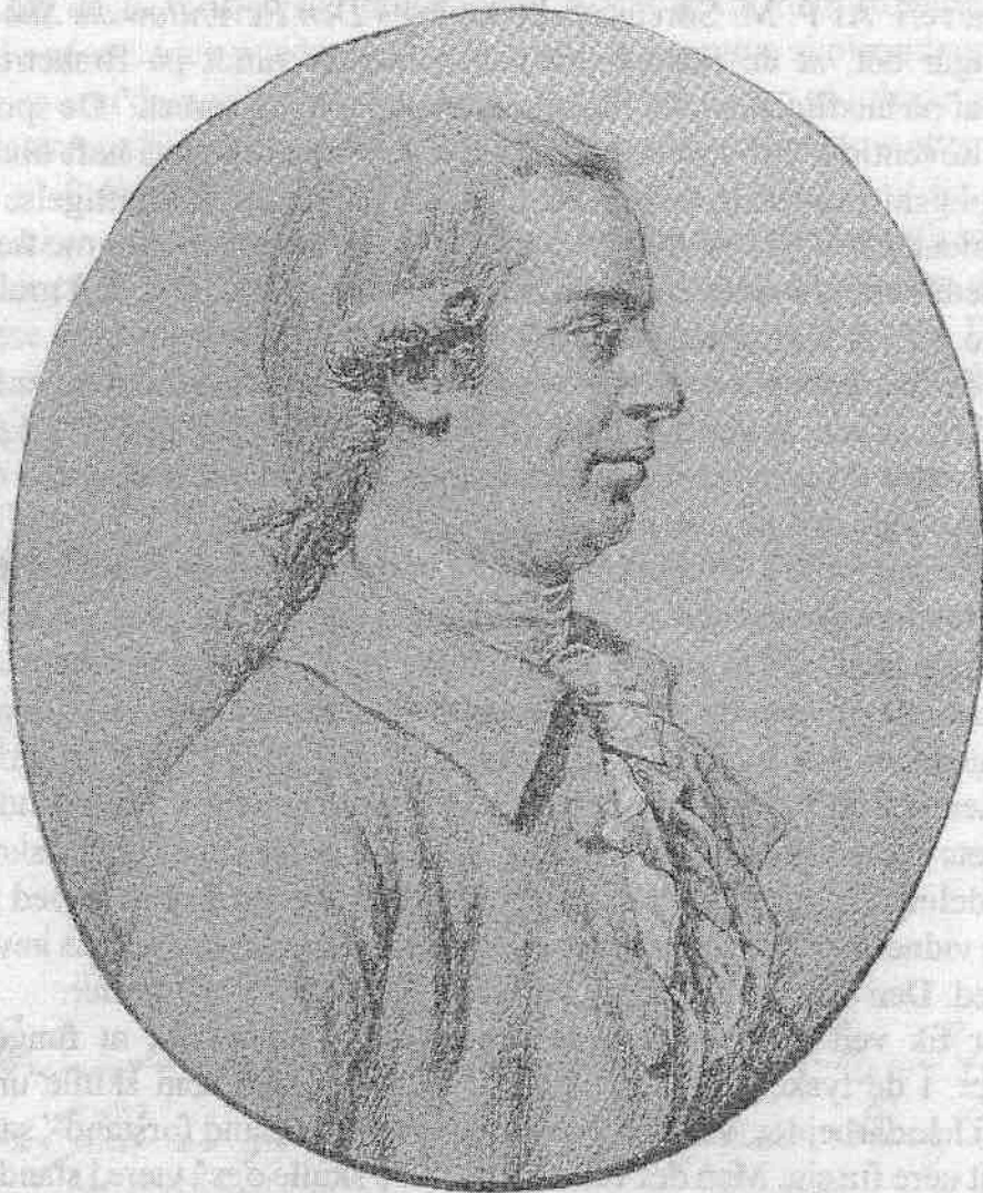
Johan Ludvig Reventlow reformerede sit skolevæsen på Brahetrolleborg i 1783. Pigerne blev her undervist i skolens forskellige fag, bl.a. i skrivning.

Både Johan Ludvig og Christian Ditlev Reventlow var meget optaget af nytten af praktiske færdigheder, og ikke mindst Christian Ditlev praktiserede selv forskellige former for håndværk. I familiens breve bliver han ofte kaldt "den stærke smed", en henvisning til hans engagement i smedearbejde og i at udføre fysiske eksperimenter. Begejstringen for håndens arbejde var en del af oplysningstidens forestillingsverden og afspejler en foragt for den gamle klassiske lærdom, der nu blev anset for forældet.